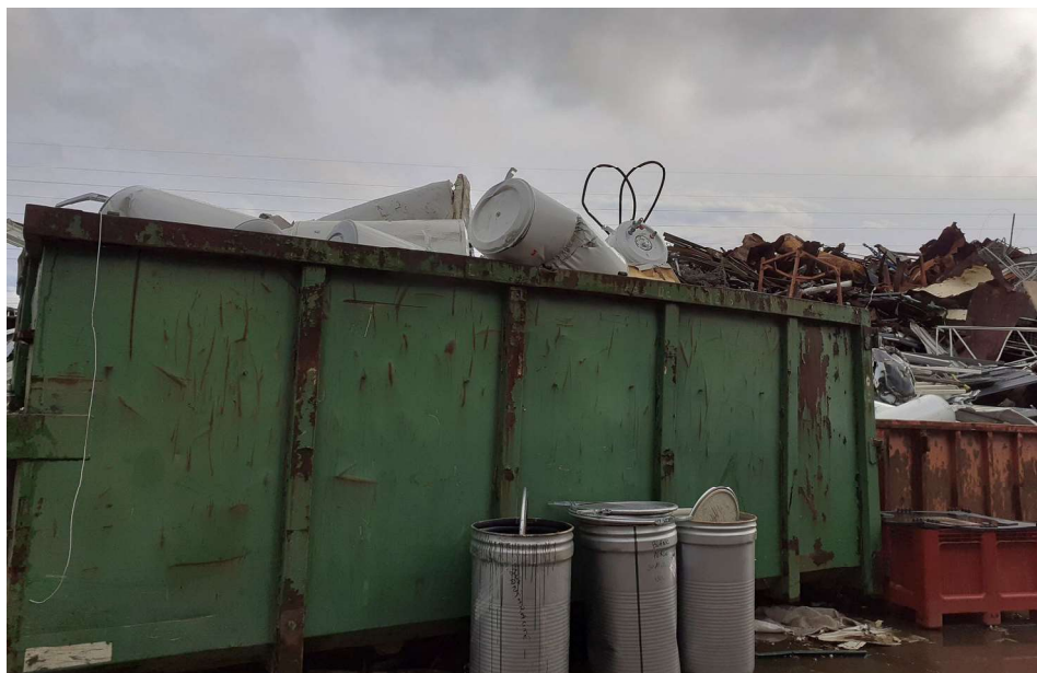
Benne de stockage des ballons d'eau chaude